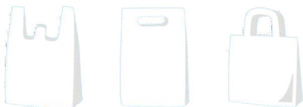
プラスチック製買物袋